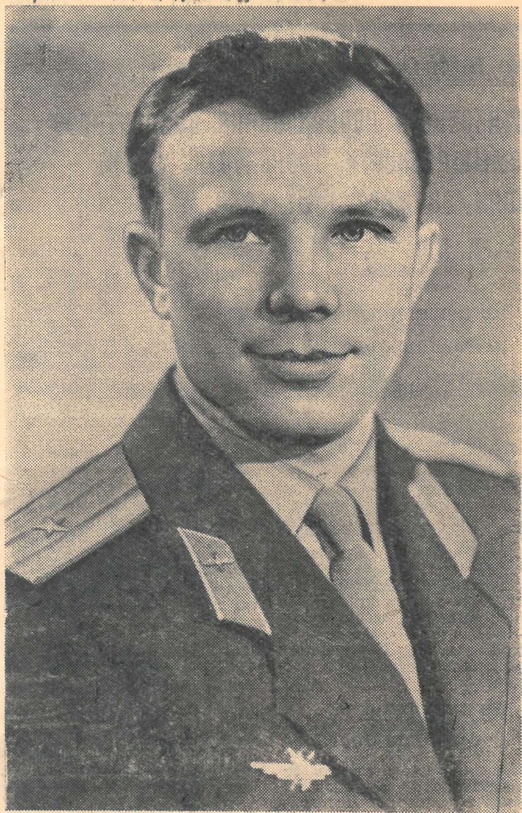
ГАГАРИН ЮРИЙ АЛЕКСЕЕВИЧ — первый в мире полет-космонавт, совершивший 12 апреля 1961 года полет в корабле-спутнике «Восток».

Славная победа нашей Родины вдохновляет всех советских людей на новые подвиги в строительстве коммунизма!